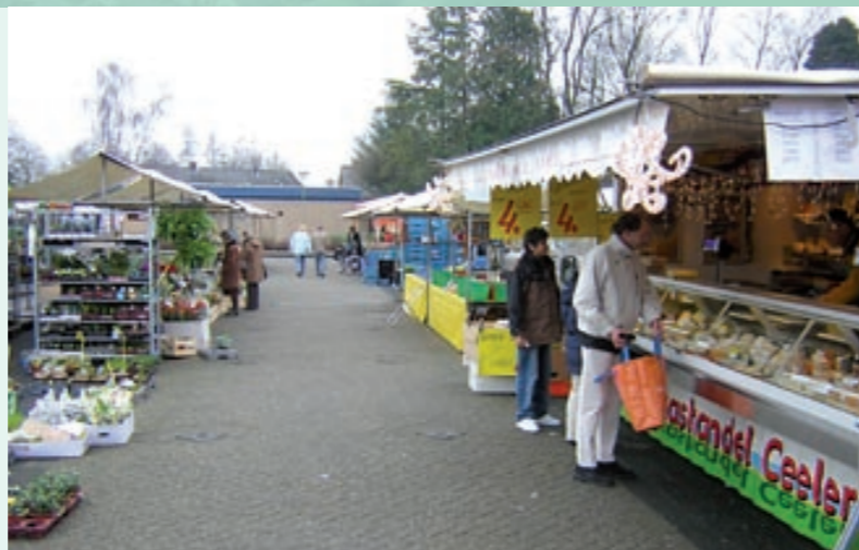
Blankensgoed ligt op een steenworp afstand van het levendige centrum van Voorthuizen.

Meer informatie over de woonwijk Blankensgoed is te vinden op de internetsite van de gemeente Barneveld. Surf naar www.barneveld.nl/blankensgoed .