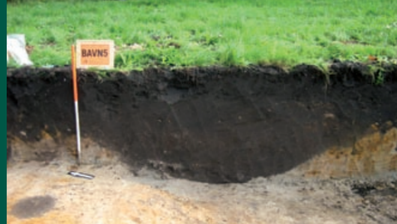
Doorsnede door de zorgvuldig aangelegde gracht om het Blankersgoed.