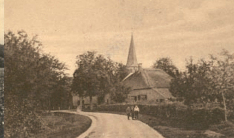
Schaapskooi bij De Heuveltjes.