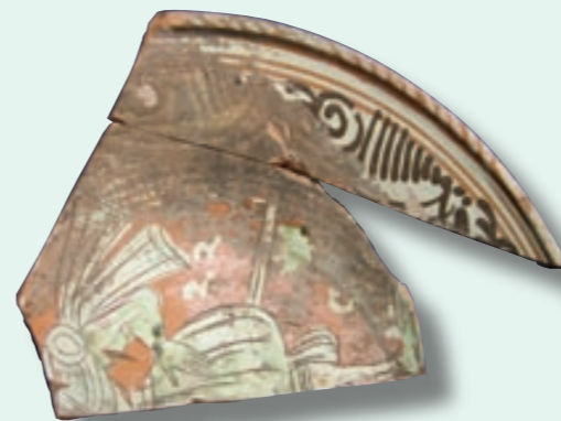
Gedateerd bord van zogenaamd Werra-aardewerk (1622) met manfiguur in adellijke kleding.