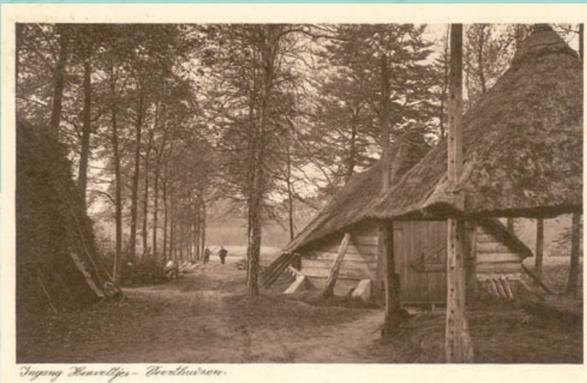
Ingang Kavelles - Voorthuizen.

Niet ver van Blankensgoed lag de ingang naar het natuurgebied De Heuveltjes.