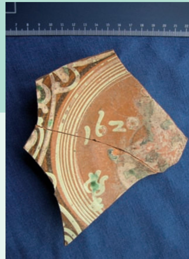
Gedateerd bord van zogenaamd Werra-aardewerk (1620).