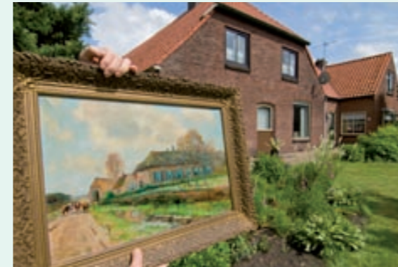
Oud en nieuwer. Op het schilderij staat de boerderij, die in 1945 tijdens de bevrijding van Voorthuizen door brand werd verwoest.

De huidige boerderij was, met méér grond, in bezit van de familie Van de Bleek.